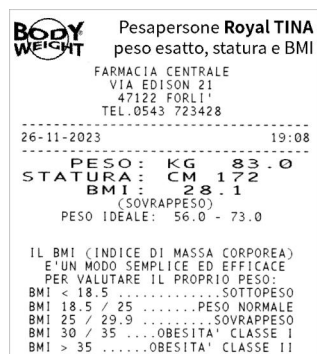
Esempio di biglietto