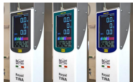
Royal Tina è disponibile con i pannelli in 3 colori: grigio, azzurro e verde